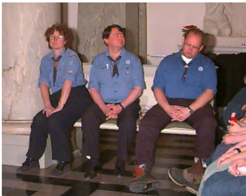
Det arbetande utskottet (AU) förbereder sig för 97-års prövningar. De ser pigga ut, eller vad tycker ni?

PS: Visste du att Gröna spåret har inspirerat många ledare att skapa mera, till exempel Sång&Mysik!